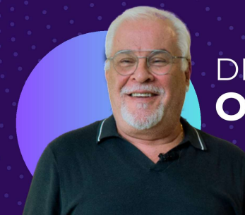
DR. EFRAÍN OLSZEWER

Experta en salud y bienestar integral, conocida por su trabajo en biohacking y nutrición funcional.